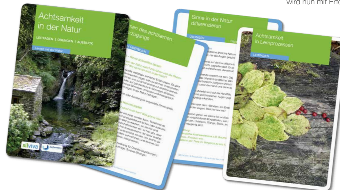
Kartenset „Achtsamkeit in der Natur“ – eine wichtige Wahrnehmungsschulung.