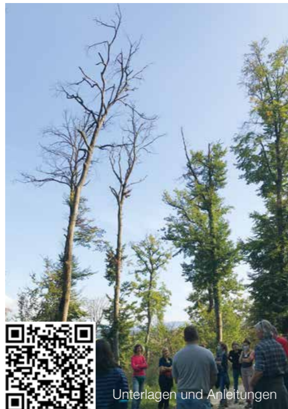
Unterlagen und Anleitungen

Klimawandel ist ein hochaktuelles Thema – mit den vorgestellten Methoden können Lehrpersonen und Forstfachleute dieses im Unterricht oder in Waldexkursionen aufnehmen und Schülerinnen und Schüler in ihrem Verständnis einen Schritt weiterbringen.